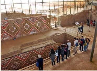
Huaca de la Luna

Si te interesa encontrarte con las culturas preincaicas, Trujillo es el mejor lugar pues a pocos kilómetros destacan dos zonas arqueológicas. La primera, Chan Chan, es la ciudad de adobe más grande de América y capital del extinto reino Chimú (Siglo XII – siglo XV). Fue declarado Patrimonio de la Humanidad por la UNESCO en Noviembre de 1986. La segunda zona arqueológica está conformada por Las Huacas del Sol y La Luna, antiguos santuarios de la cultura Moche que se desarrolló entre los siglos II y V.